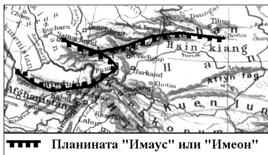
Планината "Имаус" или "Имеон"

Изследвайки топографията на Централна Азия, по данните от китайските хроники и др. извори, достигам до извода, че първоначалното местожителство на хазарите и българите е бил Източен Тяншан, в района на Турфан-Урумчи-Хами, където по време на Империята Хан, се е намирала федерация от шест племена, носеща името на най-голямото Чеси (Cheshi) 車師, или също Гуши (Gushi) 姑师. То е обитавало около съвр. Турфан, а другите са били разположени в северно и източно направление, към Урумчи и Хами. Тези племена са: Чеси (Cheshi) 車師, Пулей (Pulei) 蒲類, Цеми (Qiemi) 且弥, Беилу (Beilu) 卑陸, Ичжи (Yizhi) 移支, Юли (Yuli) 郁里 / 郁立.